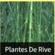
Plantes De Rive